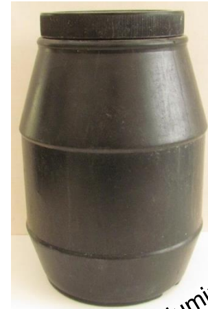
Testigo (Fosfuro de aluminio)