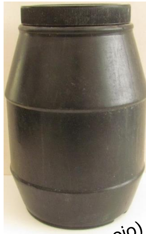
Testigo (sin gorgojo)