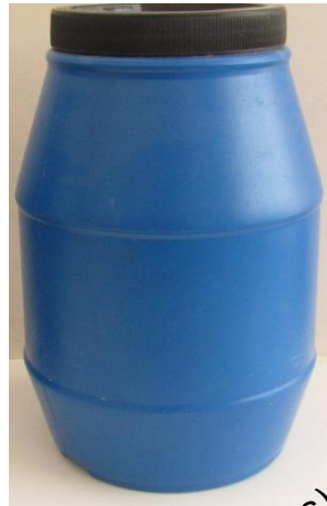
Testigo (con gorgojos)